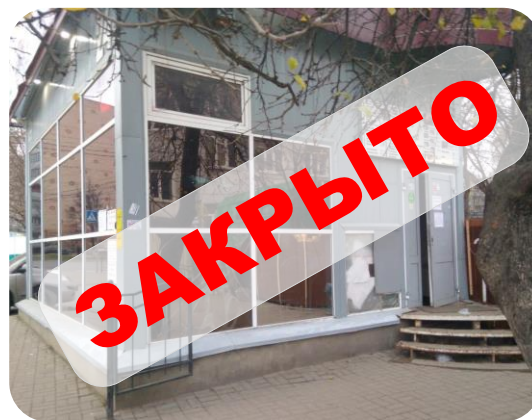
кафе «Зазеркалье» ул.Билибина, 19а