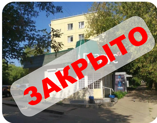
кафе «Градус» ул.Николо-Козинская, 22а