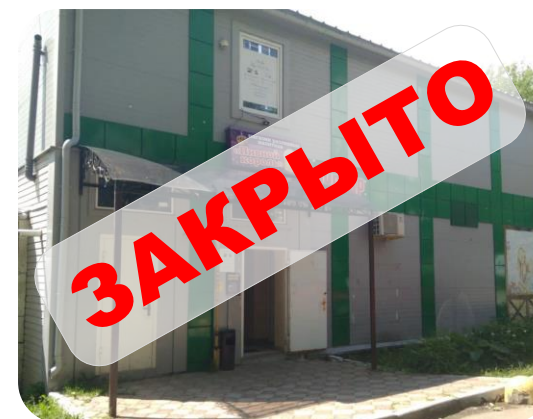
бар «Пивной король» ул. Маршала Жукова, д. 38