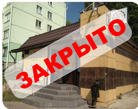
бар «Свои в доски» ул.Николо-Козинская, 7а