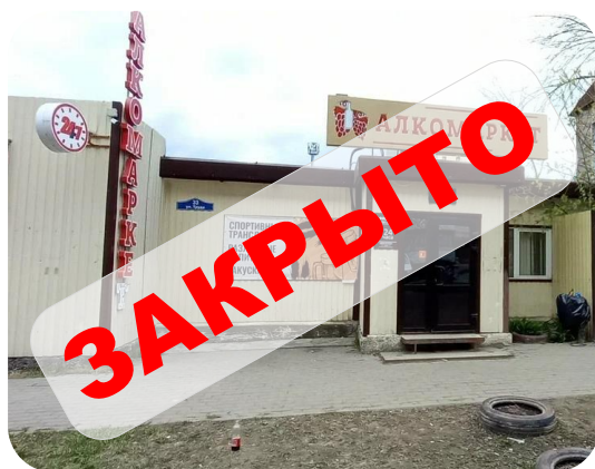
кафе-бар «Алкомаркет» ул.Труда, 33а