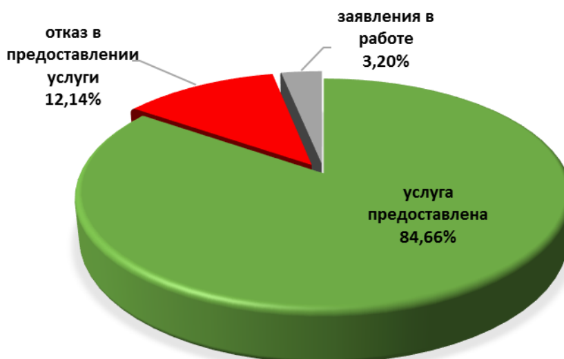
Диаграмма 3. Информация о принятых решениях о предоставлении муниципальной услуги

Общая информация о предоставленных муниципальных услугах в III квартале 2025 года представлена в таблице 2.