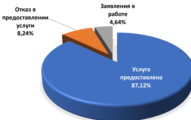
Диаграмма 3. Информация о принятых решениях о предоставлении муниципальной услуги

Общая информация о предоставленных муниципальных услугах в I квартале 2024 года представлена в таблице 2.