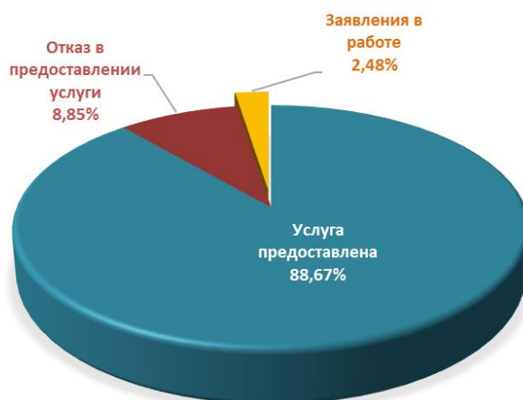
Диаграмма 3. Информация о принятых решениях о предоставлении муниципальной услуги

Общая информация о предоставленных муниципальных услугах в III квартале 2024 года представлена в таблице 2.