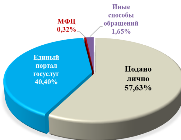
Диаграмма 1. Информация о поступивших заявлениях на предоставление муниципальных услуг

В рассматриваемом отчетном периоде в электронном виде предоставляется 40 муниципальных услуг. Наиболее востребовано получение заявителями в электронном виде услуг управления архитектуры, градостроительства и земельных отношений города Калуги (2 739 запросов направлено в электронном виде (62,94% от общего объема поступивших заявлений), управления образования города Калуги (1600 запросов направлено в электронном виде (78,3% от общего объема поступивших заявлений).