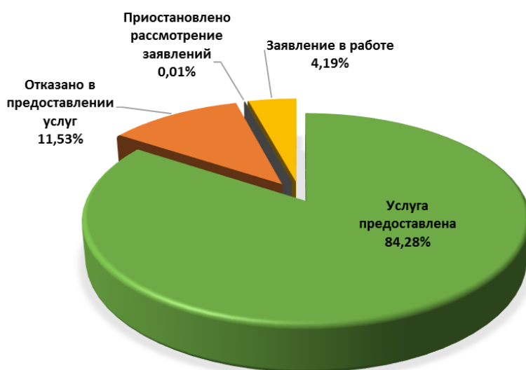
Диаграмма 5. Информация о рассмотренных заявлениях на предоставление муниципальных услуг

Положительное решение было вынесено по 37 001 заявлениям, по 5 061 заявлениям было отказано в предоставлении муниципальных услуг, по 4 заявлениям было принято решение о приостановлении предоставления муниципальных услуг по основаниям, предусмотренным в административных регламентах (диаграмма 5).