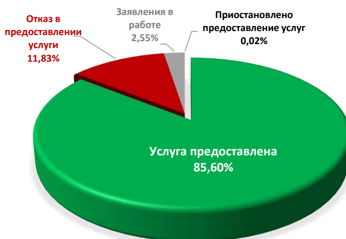
Диаграмма 3. Информация о принятых решениях о предоставлении муниципальной услуги

Общая информация о предоставленных муниципальных услугах в IV квартале 2024 года представлена в таблице 2.