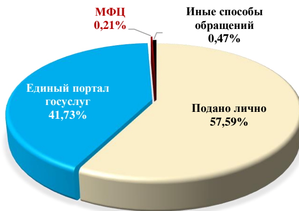
Диаграмма 1. Информация о поступивших заявлениях на предоставление муниципальных услуг

В декабре 2024 года в электронный вид переведена муниципальная услуга управления социальной защиты города Калуги по подтверждению права бесплатного проезда в городском транспорте общего пользования отдельным категориям граждан.