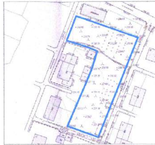
Санитарно-защитная зона предприятий, сооружений и иных объектов в соответствии с ПЗЗ