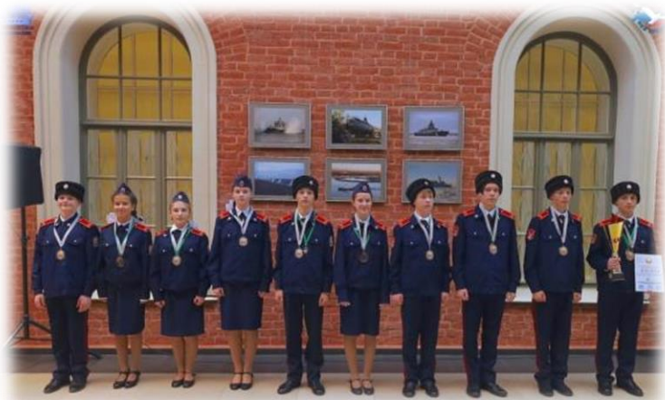
Международный слёт кадет России и Ближнего Зарубежья «Кадетское содружество» (г.Санкт-Петербург)