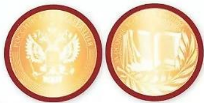
Медаль «За особые успехи в учении» I степени (золотая)

Утвержден внешний вид золотых и серебряных медалей для выпускников школ