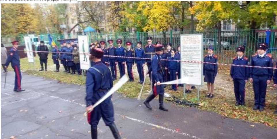
Региональный смотр-конкурс «Лучший казачий кадетский класс»

ГОРОДСКАЯ УПРАВА ГОРОДА КАЛУГИ Управление образования города Калуги