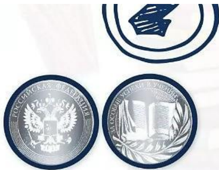
Медаль «За особые успехи в учении» II степени (серебряная)