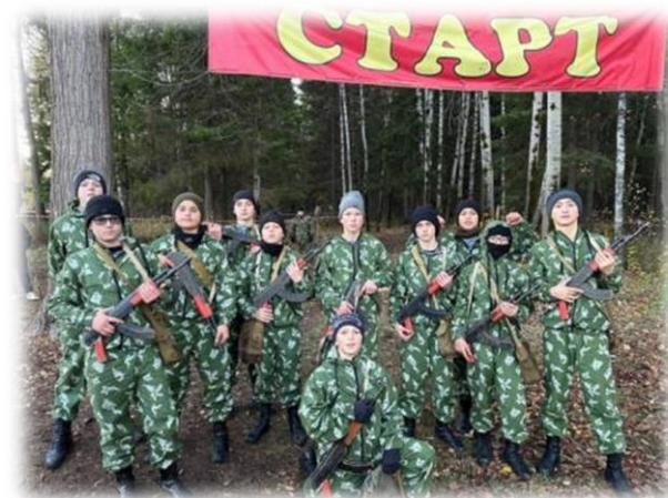
Всероссийский кадетский фестиваль-форум «Виват, кадет!» (г.Пермь)