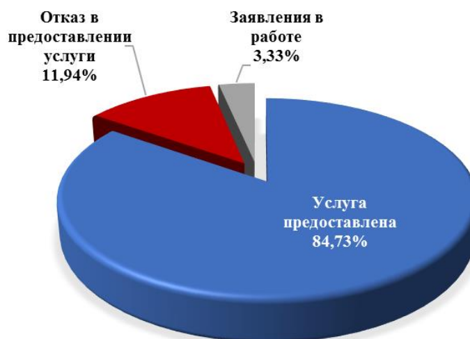
Диаграмма 3. Информация о принятых решениях о предоставлении муниципальной услуги

Общая информация о предоставленных муниципальных услугах во втором квартале 2024 года представлена в таблице 2.