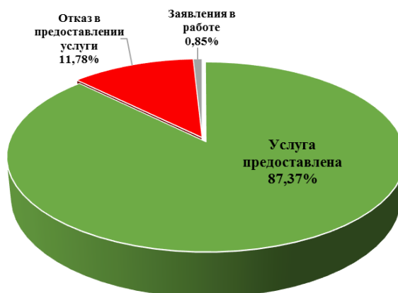
Диаграмма 3. Информация о принятых решениях о предоставлении муниципальной услуги

Общая информация о предоставленных муниципальных услугах в IV квартале 2025 года представлена в таблице 2.