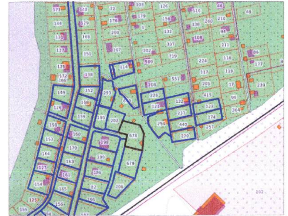
Ситуационный план М 1:4000