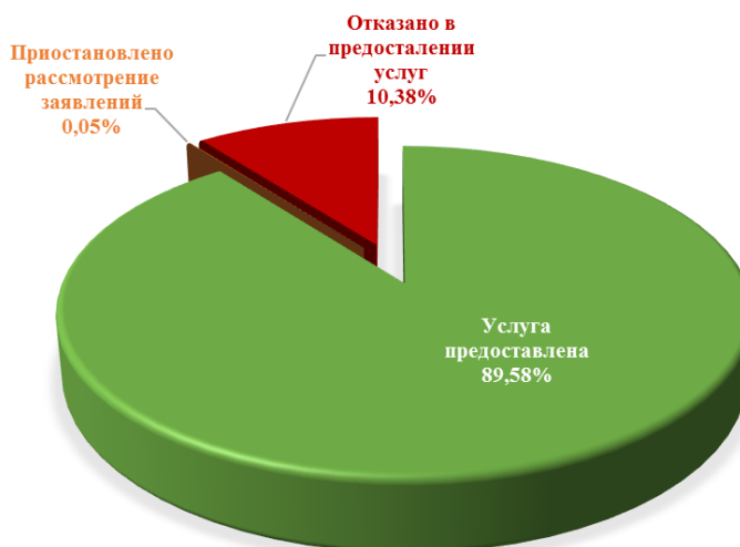
Диаграмма 5. Информация о рассмотренных заявлениях на предоставление муниципальных услуг

На предоставление муниципальных услуг в 2024 году в органы Городской Управы города Калуги поступило 2 жалобы в управление архитектуры, градостроительства и земельных отношений города Калуги в отношении услуги по предварительному согласованию предоставления земельных участков на территории муниципального образования «Город Калуга». В отношении поступивших жалоб заявителям направлен разъясняющие ответы.