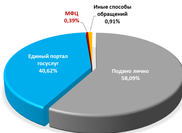
Диаграмма 1. Информация о поступивших заявлениях на предоставление муниципальных услуг

По сравнению с 2023 годом в 2024 году вырос объем заявлений, поданных на предоставление муниципальных услуг, на 2 047 заявлений. Возросла популярность получения услуг в электронном виде. Заявителями было подано на 2 872 заявления больше, чем в 2023 году. В общем объеме заявлений доля электронных услуг также увеличилась на 4,47%.